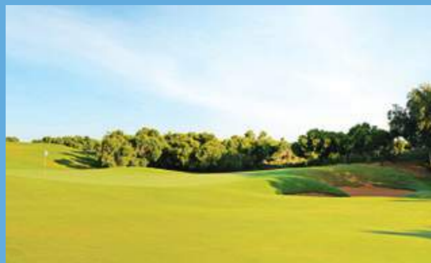
Le golf de Mogador

Lieu de repos et de loisir, la station Mogador est pourvue de trois golfs respectant la topographie naturelle du site avec ses dunes, son sable et sa végétation. Tout est fait pour répondre aux désirs du visiteur. Le tennis ou le golf pour garder la forme, le spa pour se détendre et les boutiques de luxe pour le shopping.