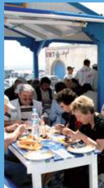
Grillades de poisson fraîchement pêché