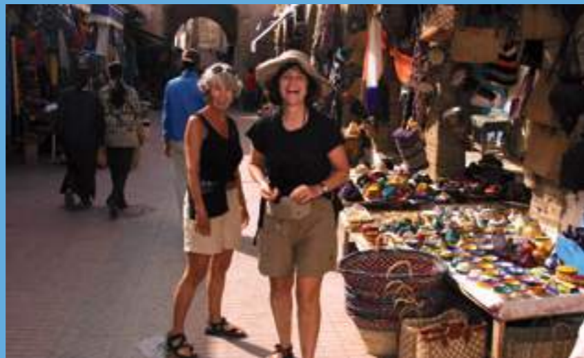
Flânerie dans les ruelles de l'ancienne médina à la découverte du savoir faire de ses artisans

Cœur battant d'Essaouira, la place Moulay Hassan est le lieu le plus animé de la ville. Située à l'intérieur de la médina, non loin des remparts et du port, cette jolie place arborée offre un cadre idéal pour apprécier un thé à la menthe. Assis à l'une de ses terrasses de café, on peut observer le va et vient nonchalant des passants.