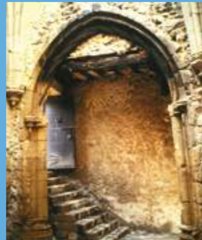
Une porte d'influence portugaise