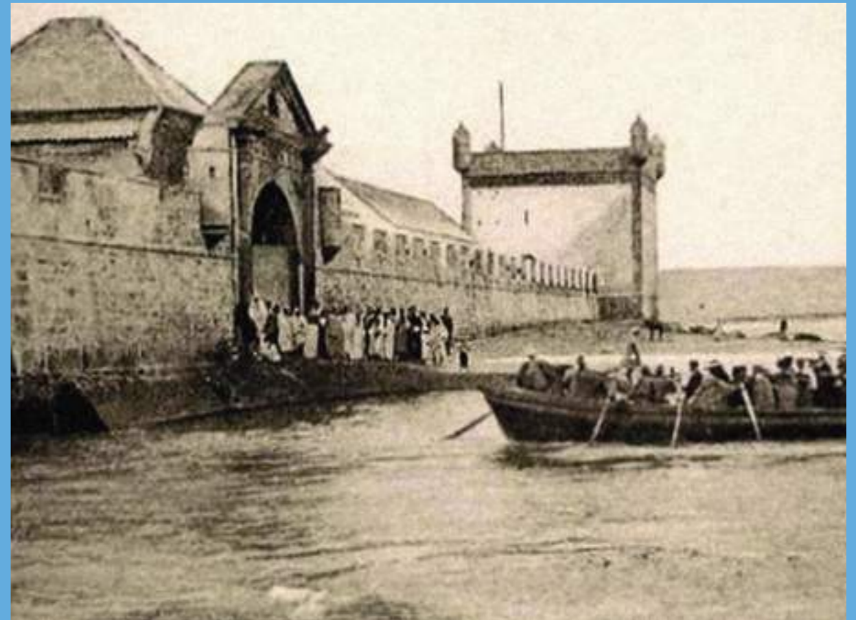
Arrivée de touristes à la porte de la marine avant la construction du port (1910)