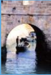
Un pêcheur rejoignant le port