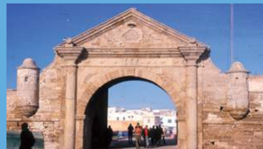
La porte de la marine

Plus qu'une cité, Essaouira est une muse à laquelle on reste attaché.