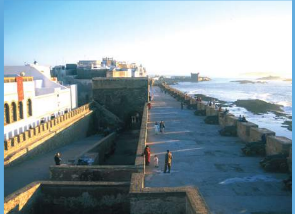
La promenade sur les remparts de la sqaia