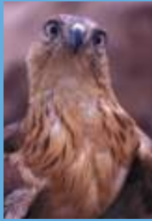
Le faucon d'Eleonore qui trouve refuge dans les îles purpuraires