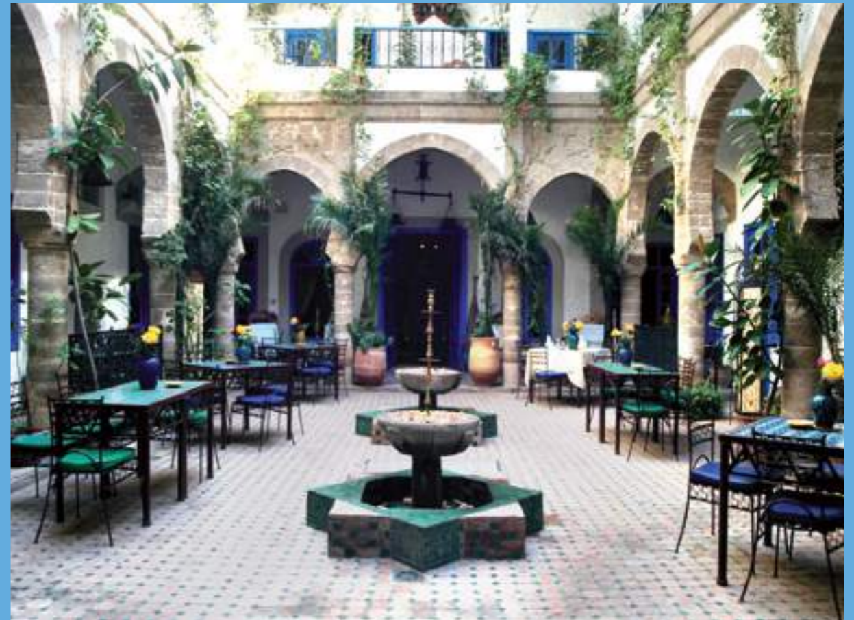
Le patio du Riad « Riad Al Madina » ayant accueilli le célèbre chanteur Jimmy Hendrix en 1969

Les îles Purpuraires tirent leur nom de la pourpre, extraite d'un coquillage, le murex. Appliquée en teinture, elle donne au tissu une couleur rouge vif avec des reflets variant du bordeaux au violet. Le rouge étant dans l'Antiquité le symbole de la puissance temporelle et spirituelle, la couleur pourpre était très appréciée et recherchée par l'aristocratie romaine.