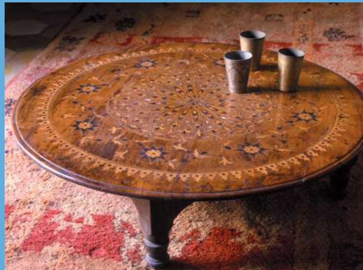
Une table en bois de thuya travaillée par les artisans marqueteurs de la ville