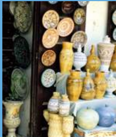
Une boutique de poterie