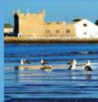
Les îles purpuraires, réserve ornithologique

A peine est-il arrivé qu'il est déjà temps de rentrer préparer le festival de l'année, Woodstock. Ce séjour éclair mais légendaire marquera à jamais l'histoire de la ville.