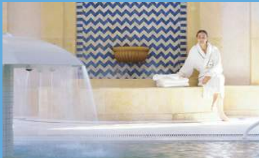
La ville est réputée également pour la thalassothérapie

Le vent souffle fort sur la baie d'Essaouira. Si l'on apprécie la protection de ses remparts, les planchistes, surfeurs et kiteboarders se jettent à l'eau avec le plus grand plaisir. La cité est devenue, en quelques années, un haut lieu des sports de glisse nautique et accueille notamment