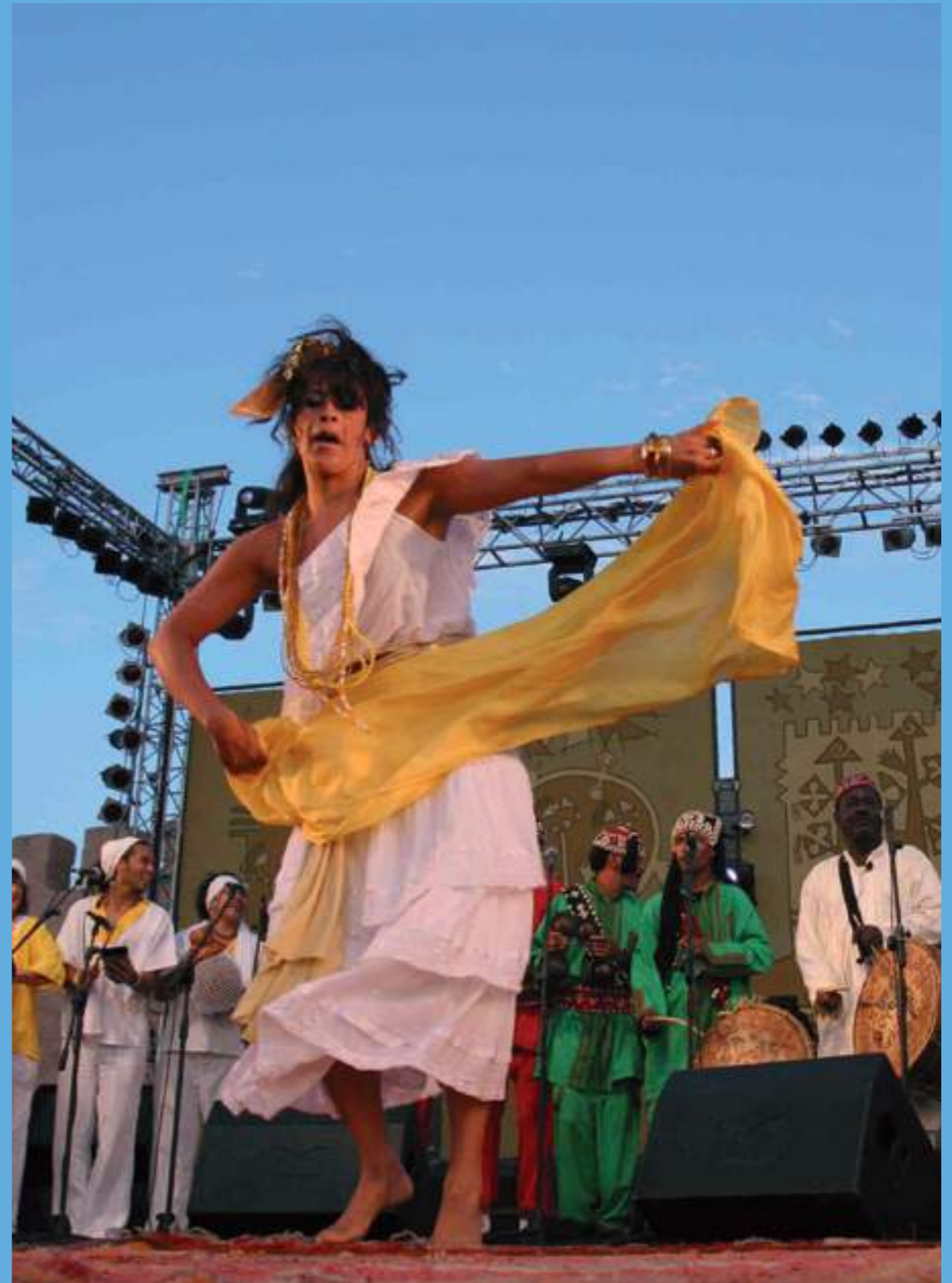
Essaouira célèbre chaque année le festival gnaoua qui attire un large public