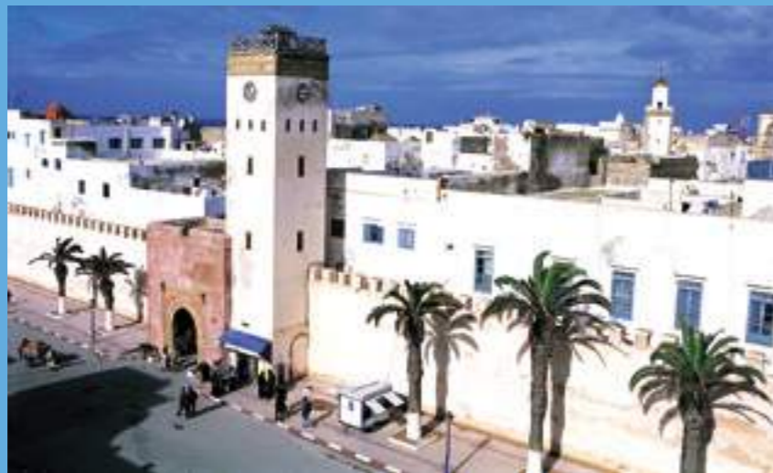
Vue sur la médina

Aujourd'hui, Essaouira est un havre de paix qui inspire des artistes venus des quatre coins du monde. Inscrite au patrimoine mondial de l'UNESCO, sa médina traverse les époques et semble protégée des affres du temps. Derrière les remparts se cache une cité lumineuse avec ses venelles enchevêtrées, ses petites places et ses maisons blanchies à la chaux. Décor mythique du film «Othello» d'Orson Welles, elle influence et subjugué les cinéastes. Ridley Scott y recrée Jérusalem pour le film «Kingdom of Heaven». Paradis de Jimmy Hendrix et des musiciens Hippiques des années 70, elle vit toujours au rythme de la musique Gnaoua.