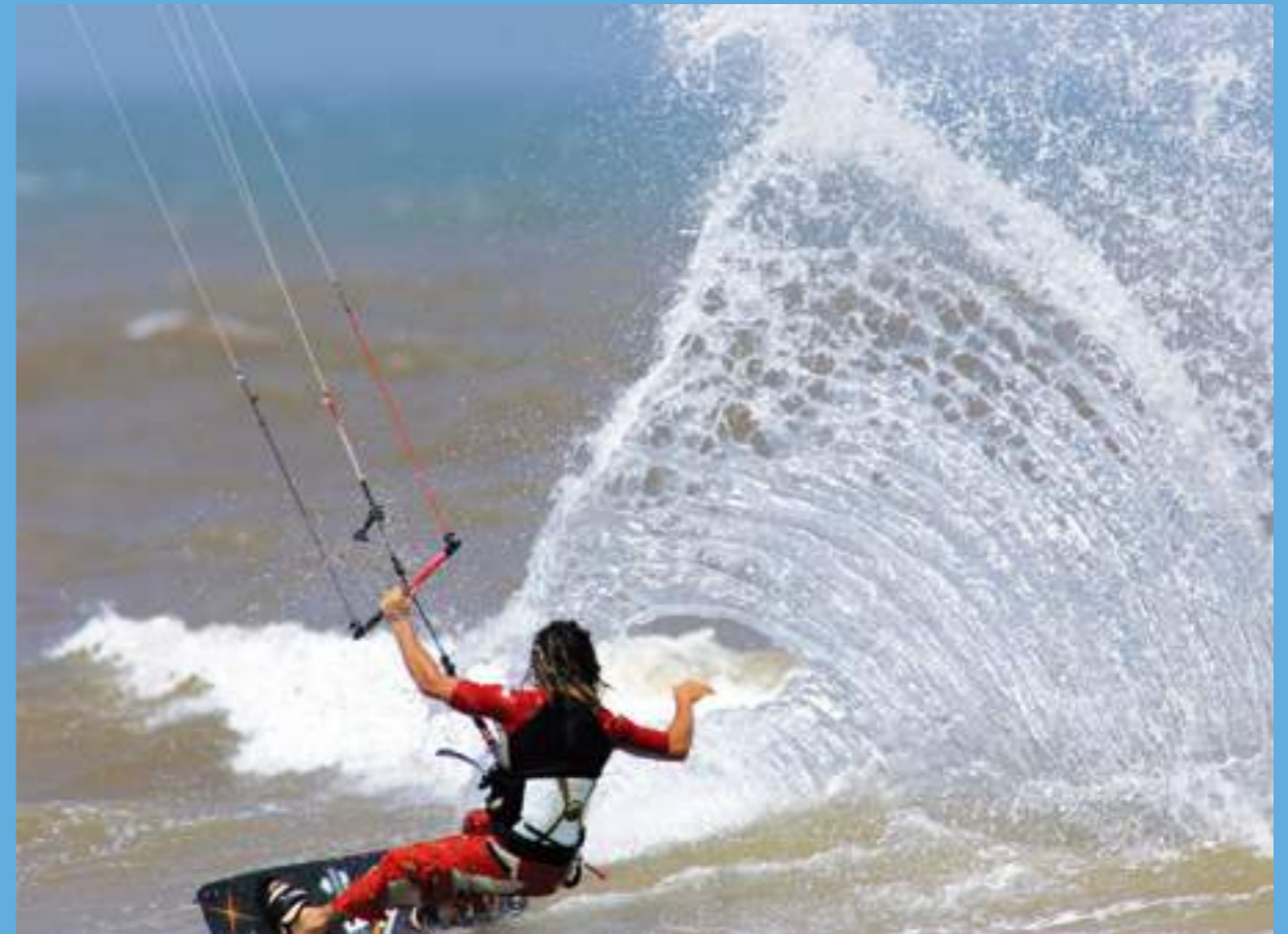
Un kiteboarder effleurant une vague. La ville accueille chaque année une compétition internationale de Kiteboard