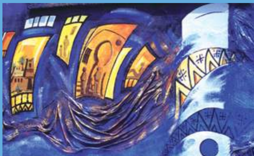
Une œuvre peinte par un artiste d'Essaouira

Les bijoux en argent d'Essaouira sont réputés pour leur qualité et leur finesse. Cet artisanat doit son développement et sa notoriété aux orfèvres juifs du XVIII ème siècle. Les techniques de conception et de fabrication sont semblables à celles d'autrefois et la créativité des artisans reste inépuisable.