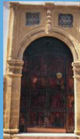
Une porte typique des maisons de la médina

Protégeant la cité des attaques venues de l'océan, le bastion nord était une vaste plateforme d'artillerie encerclée de murailles crénelées. La terrasse de ce bastion offre une vue unique sur la médina et la Sqala.