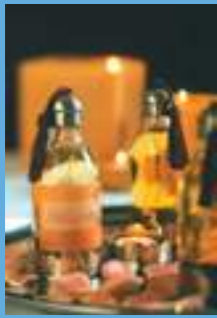
Produits cosmétiques naturels à base d'huile d'argan utilisés pour les soins du corps