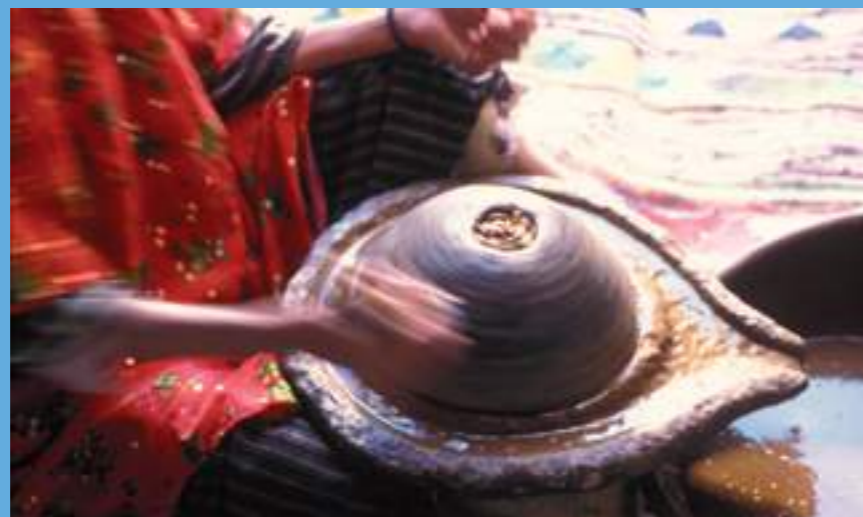
Femme berbère extrayant l'huile d'argan de manière traditionnelle

Le long de la côte, les balades vous mèneront sur des sentiers à flanc de falaise ou sur des plages de sable blanc pour y découvrir les petits villages de pêcheurs qui bordent la mer.