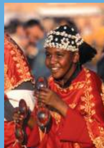
Un jeune musicien gnaoua jouant des krakebs (castagnettes)